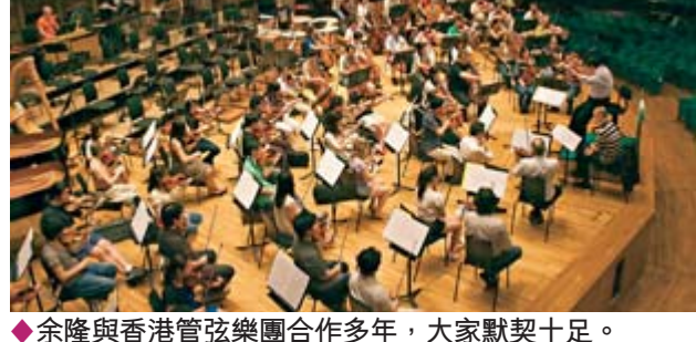
◆余隆與香港管弦樂團合作多年，大家默契十足。

一個文明城市，一定要多辦文化活動。在香港，娛樂發展很蓬勃，這不是壞事。不過，香港文化與娛樂的區別不大，而唱流行曲、做Fashion Show並不等如是文化，如果只懂得辦大型演唱會、娛樂表演，是不完全的。唯有在文化方面貢獻世界，才能夠成為一個備受認同的國際大都會。」