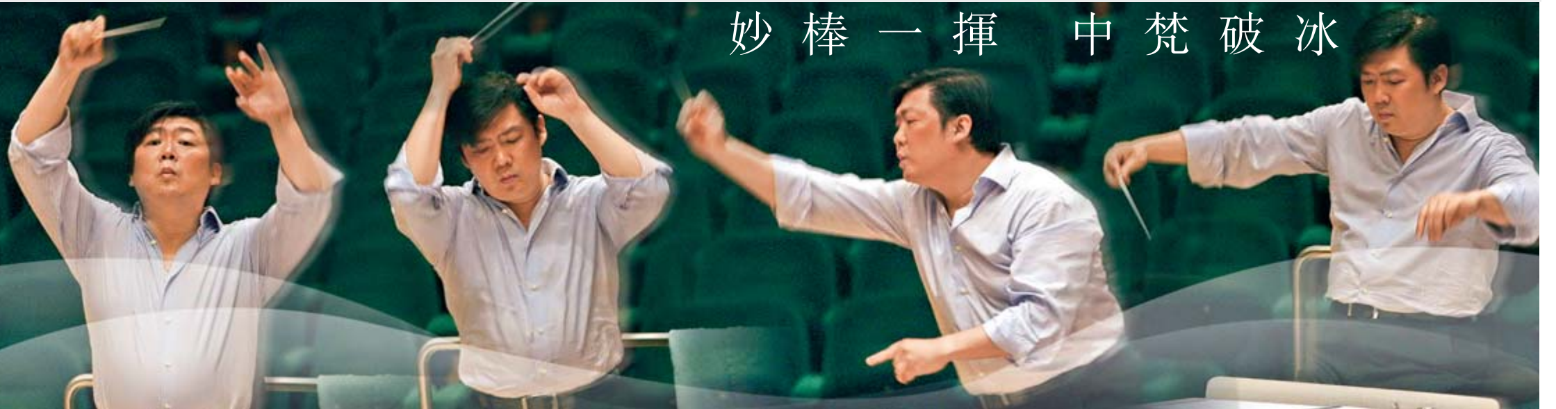
◆余隆與香港管弦樂團合作多年，大家默契十足。

西九龍文化項目的設計正進行公眾諮詢，正代表萬眾期待的本地國際級文化設施終於上馬。不過，原來除了香港人感到興奮之外，中國指揮大師余隆同樣熱切期待，他認為香港需要多辦文化活動，才夠資格做一個備受認同的國際大都會。